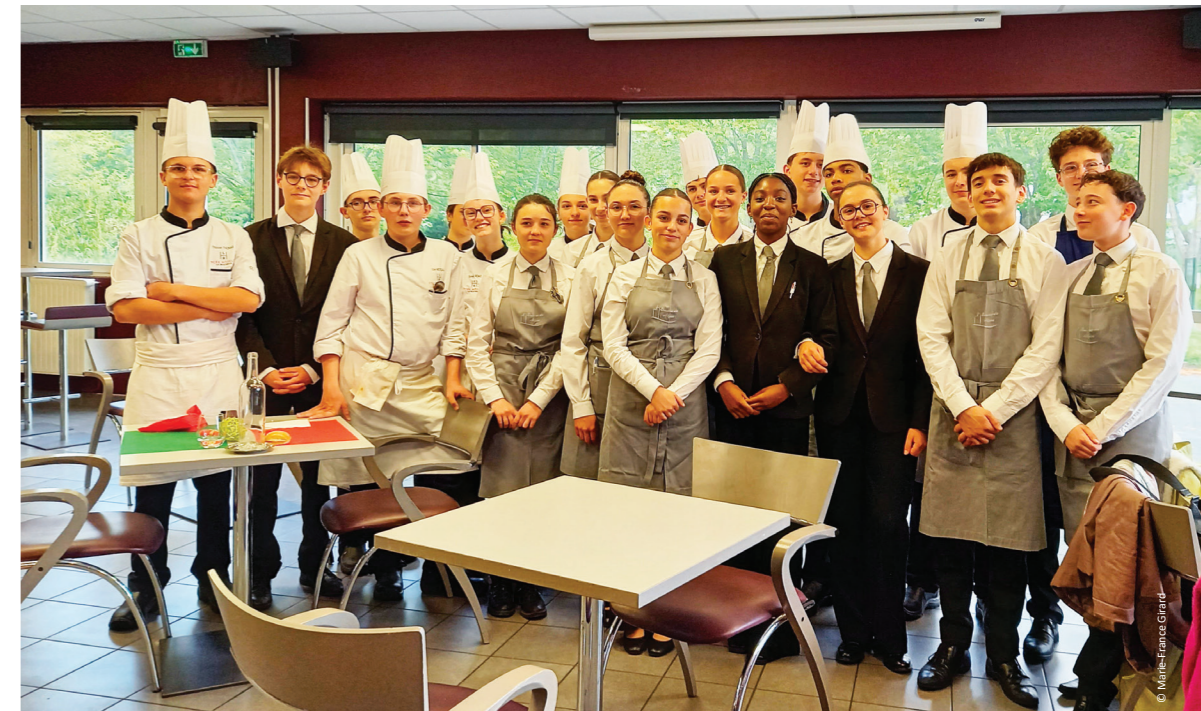
L'équipe de cuisine et de service du jour

En plus de l'apprentissage d'un métier, les élèves trouvent une « famille » au cadre rigoureux mais bienveillant. La présence d'un internat et la réputation du lycée permettent un bassin de recrutement très large, de la Vendée à la Gironde et même au-delà. Les formations sont nombreuses, du CAP au BTS et des certificats de spécialisation (métiers du bar, sommellerie ou encore desserts de restaurant). Il existe aussi, sous l'égide du CFA, des formations