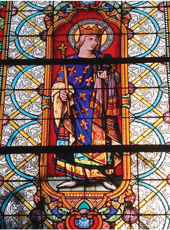
Le vitrail de saint Louis

les Filles de la Sagesse (3) consacraient leur vie au soin des pauvres et des malades, honorant et préservant ainsi le sens « noble » de ce lieu : la dévotion envers les plus démunis du roi saint Louis (4) (notamment représenté sur un de ses vitraux).