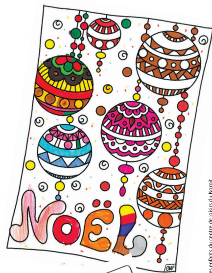
Les enfants du centre de loisirs du Noroit