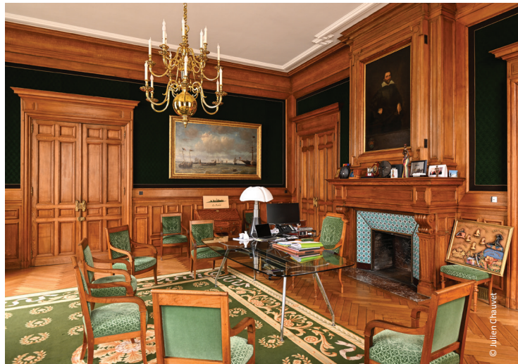
Qui sera le prochain occupant ?